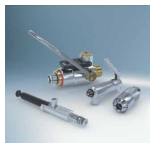
Brzi konektori 4)