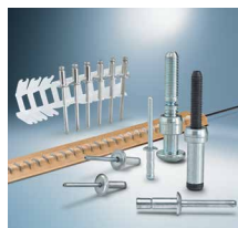
Tehnologija slepih zakovica