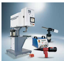
Instalaciona tehnologija i oprema