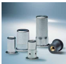
Slepe zakivne matice