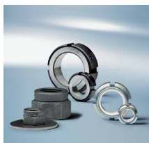
Matice sa funkcijom zaključavanja