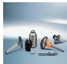
Elementi za brzo otpuštanje i klipovi sa oprugom