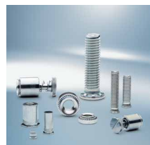
Vijci i matice za utiskivanje