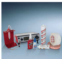
Lepkovi i zaptivne mase 1)