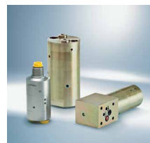
Pojačivači pritiska 3)