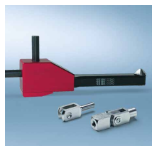
Specijalni procesi 2)