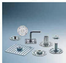
Spojni elementi za kompozitne materijale