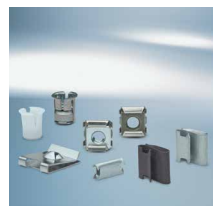
Brzo-spajajući elementi i klipse