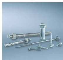
Građevinski vijci 2)