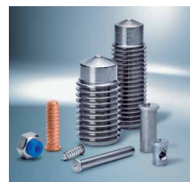
Vijci i oprema za zavarivanje 1)